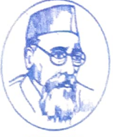
भारतरत्न महर्षी धोंडो केशव कर्वे